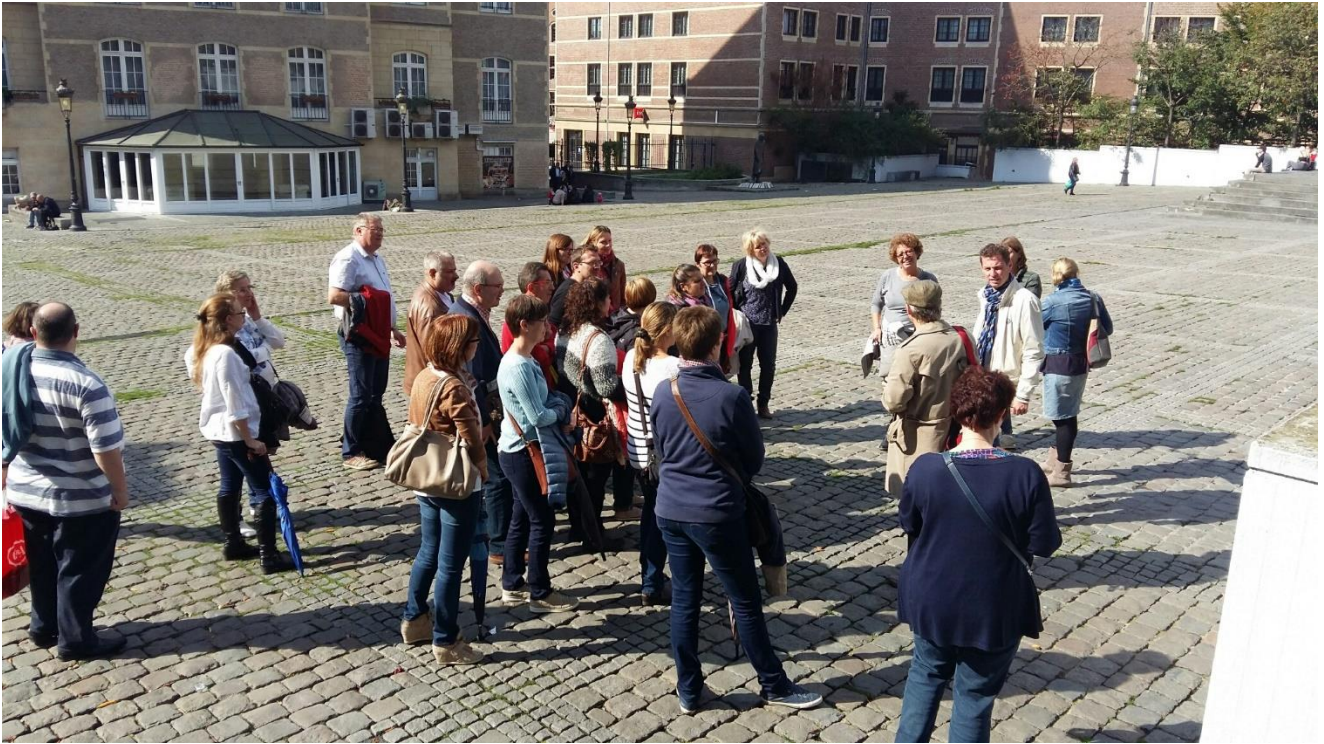
Place d'Espagne à Bruxelles, à côté de la gare centrale.

Certains endroits à Bruxelles, proches des bâtiments de la banque, sont pourtant inconnus pour beaucoup d'entre nous. Des balades-découvertes comme « de la banque à la Bourse » sont l'occasion de les découvrir.