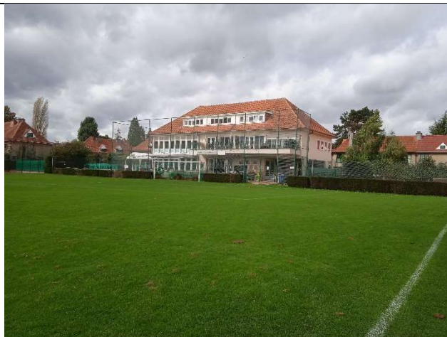
Clubhuis 22, Boogschutterslaan

Dit was ook het geval in “Le Logis” waar een terrein werd voorzien met sportinfrastructuur ten voordele van het personeel van de ASLK en hun familie. Dit terrein, gelegen aan de Boogschutterslaan op enkele passen van de Drie Linden, wordt beheerd door de Sportkring die er de nodige infrastructuur heeft voorzien voor zijn leden : voetbalvelden, tennispleinen, een bowling, tafeltennis en een clubhuis. Alles wat nodig is voor een blijvende groene long in het hart van de tuinwijk.