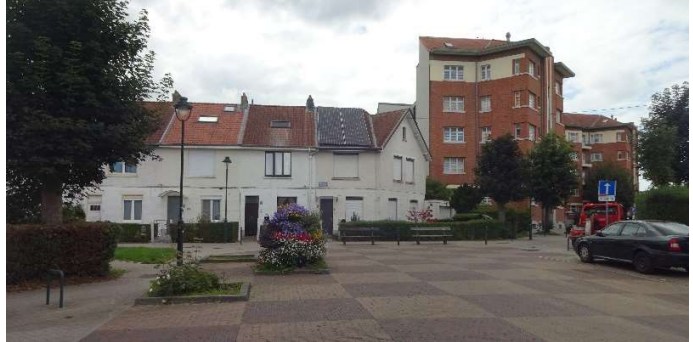
“Het Rad”: enkele uitzichten van de wijk.

De tuinwijk “Goede Lucht” (Anderlecht) : gebouwd in de periode 1921 – 1923 in dezelfde stijl van “Het Rad”, is het enige dat niet is opgeslokt door de agglomeratie : hij ligt aan de andere kant van “De Ring”.