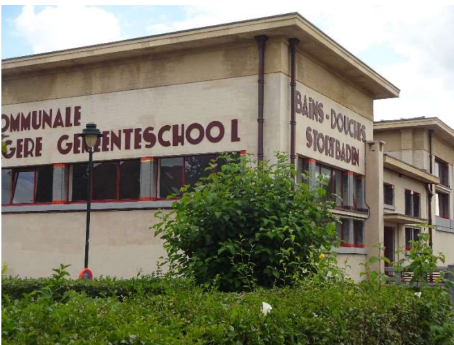
“Het Rad” (Anderlecht): gemeenschappelijke voorzieningen.

In Brussel ontstaan de tuinwijken (of tuinsteden) in de verschillende gemeenten, meestal aan de rand van de stad. Dat is ook het begin van de sociale woningbouw door de overheid. In de jaren 30 en na W.O. II wordt het bouwen van woningen door de sociale huisvestingsmaatschappijen systematisch afgebouwd ten voordele van flatgebouwen met appartementen