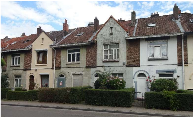
“Het Rad” (Anderlecht) : gerenoveerde en nog te renoveren woningen.

gebouwd met een school, een handelszaak, een theater... “Le grand Hornu” (Mons) en “Le Bois-du-Luc” (La Louvière) getuigen nog van deze periode. De hygiënische ideeën zien tijdens deze periode ook het levenslicht.