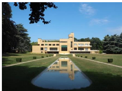
← La Villa Cavrois à Croix