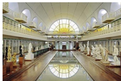
Musée de la Piscine Roubaix →