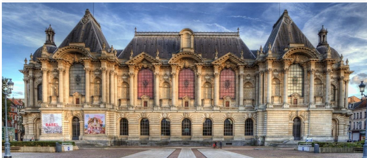
Musée des Beaux-Arts à Lille